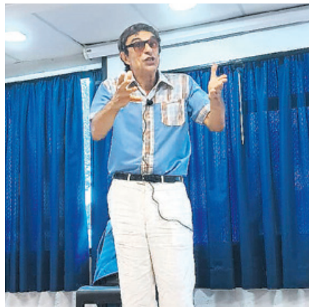
"Os mundos de Chico Xavier"