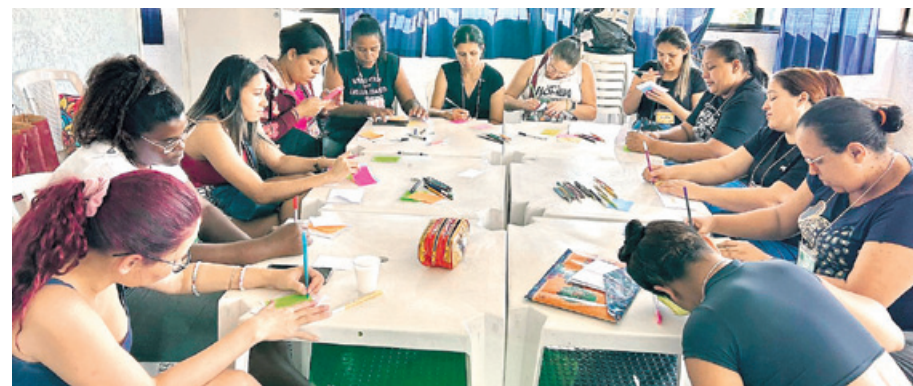
Grupo de apoio à jovens mulheres