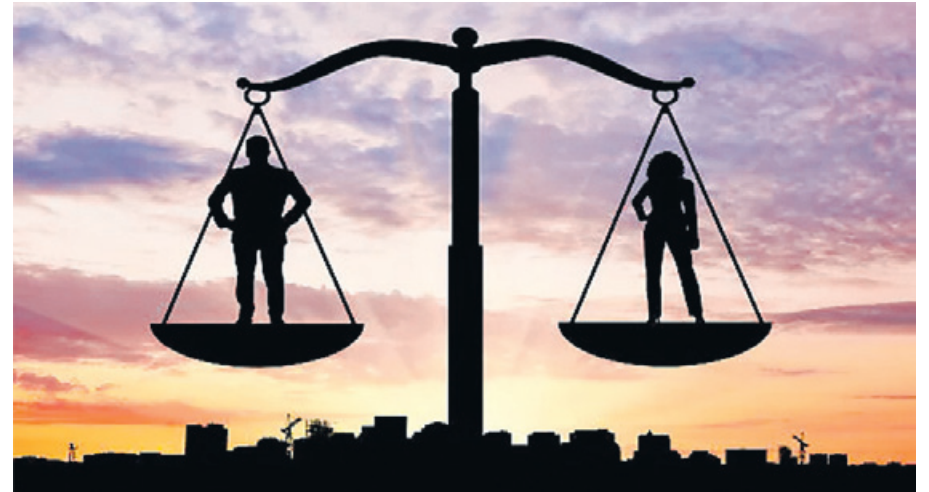
Igualdade de direitos do homem e da mulher ► Pag. 5