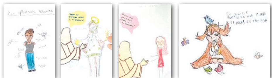
Trabalhando com as Crianças: "Prece, transmissão de pensamento"