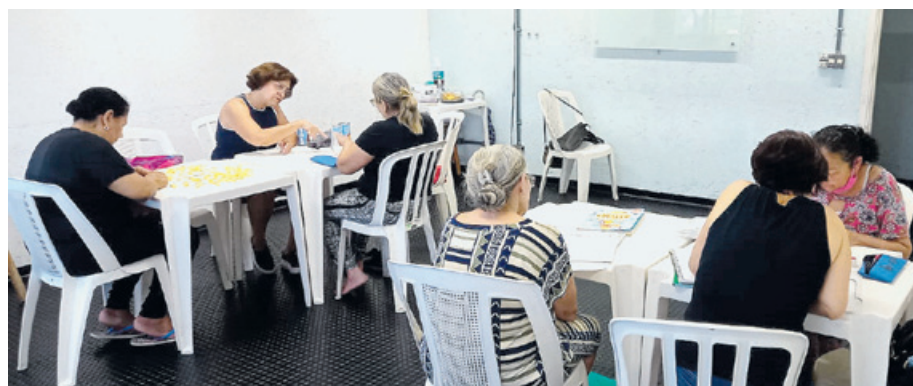
Grupo de alfabetização