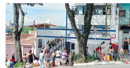
Dia de entrega de cestas básicas